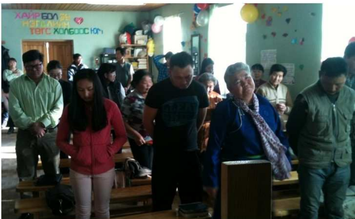
Gemeindeversammlung am Flughafen.