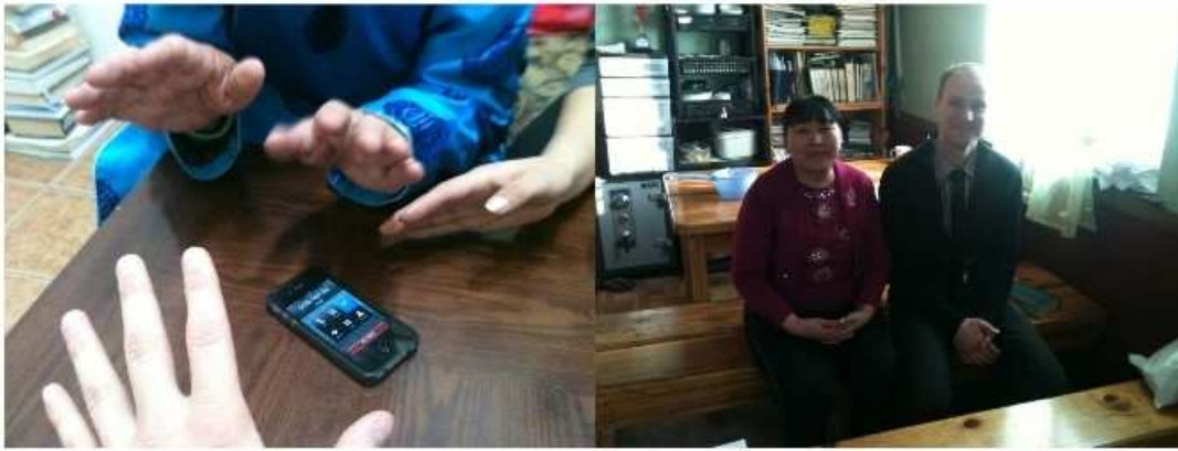
Gemeinsames Gebet für eine Kranke Frau (Herz-Probleme) im Krankenhaus per Telefon und Lautsprecher. Das geht auch wenn die Entfernung zu weit ist, denn für Gott gibt es keine Entfernungen. Er erhört Gebet und antwortet so wie er es möchte. Kurze Zeit später kam sie gesund raus.