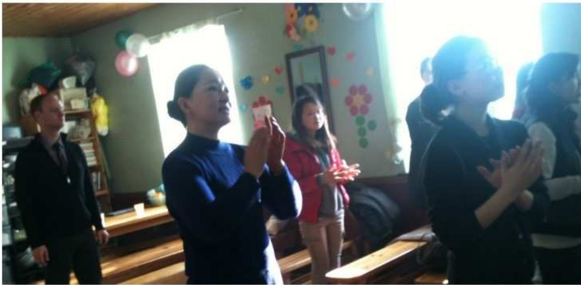
Jesus danken mit Liedern. Gemeinde in Nissikh am Flughafen, ca. 20 km von Ulan Bator entfernt.