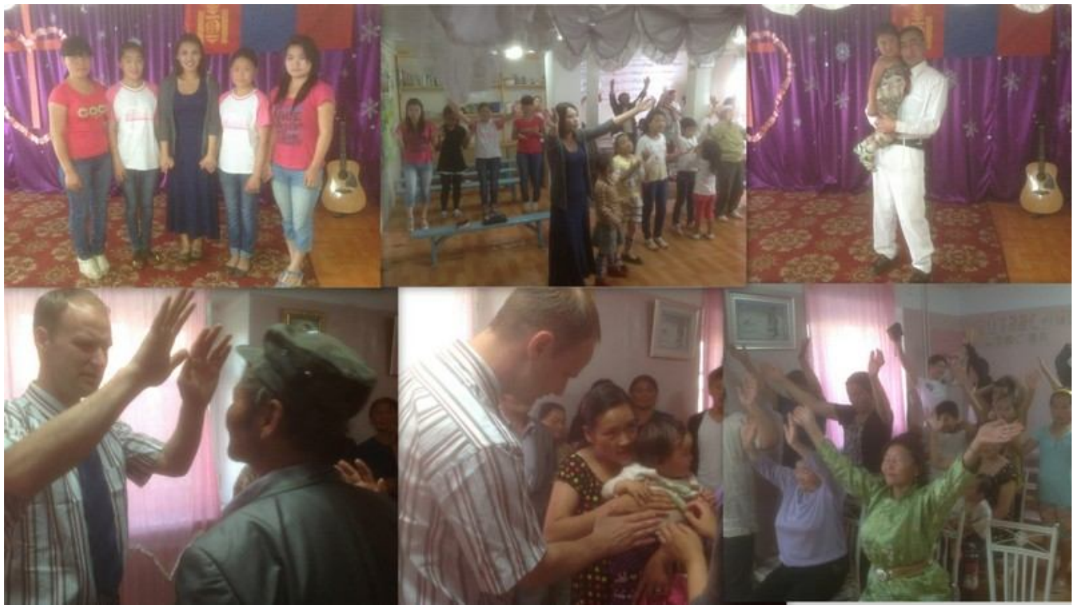
Die Liebe Gottes fließt zu den Menschen wenn wir uns aufmachen, das Evangelium glauben, und anfangen zu predigen. Hier das Worship Team, der Pastor und Gebete des Glaubens.