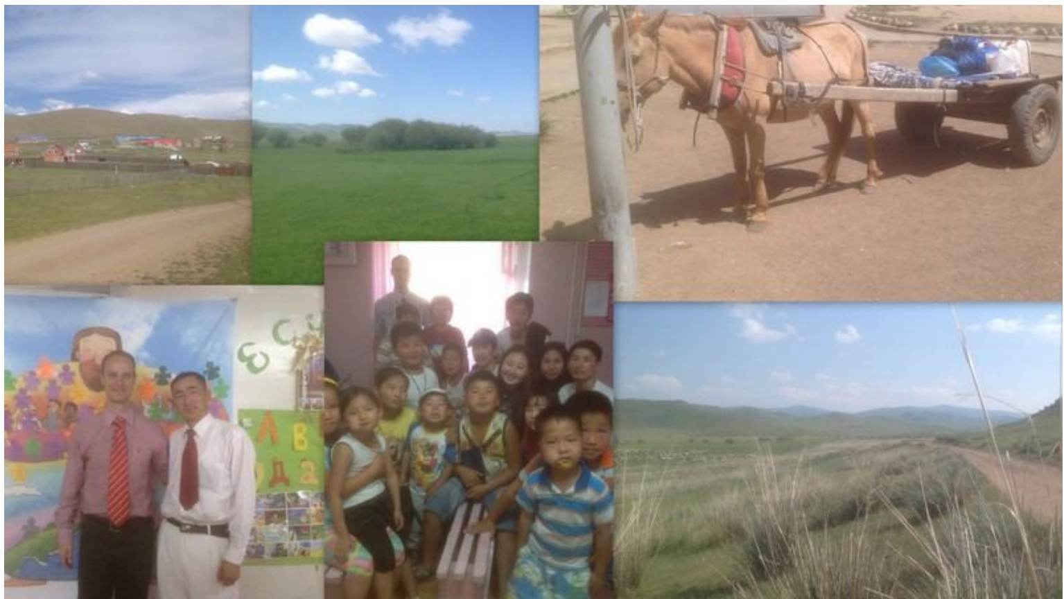
Die Gemeinden in Sharyngol und in Hongor wurden ermutigt das Evangelium zu verkündigen. Einige gaben ihr Leben Jesus und ganz viele wurden erfüllt mit dem frischen Öl vom Himmel, dem guten, lieben Heiligen Geist. Links unten der Pastor den ich seit Jahren unterstütze, er hat zusammen mit seiner Frau vor einigen Tagen das vierte Baby bekommen. Ihr name ist „Neue Apostelgeschichte“ von mongolisch ins deutsche übersetzt.