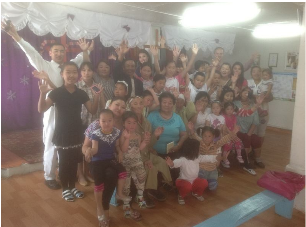
Eine Fröhliche Gestärkte Gemeinde in Sahryngol. Juni 2013

Gebetsunterstützung für ein amerikanisches Team welches Strasseneinsätze in Ulan Bator durchgeführt hat. Viele Menschen kamen und haben dem Drama zugehört. Einige eins zu eins Gespräche haben sich dadurch ergeben und viele konnten zum Gottesdienst eingeladen werden. Ganz interessant, auf dem gelben Amerikanischen Schulbus steht „2BIG 2FAIL“. Übersetzt heisst es soviel wie „Zu Gross um Zu Versagen“. Das ist ein klasse Bild auf unseren Gott. Er ist einfach zu gewaltig als das er versagen könnte.