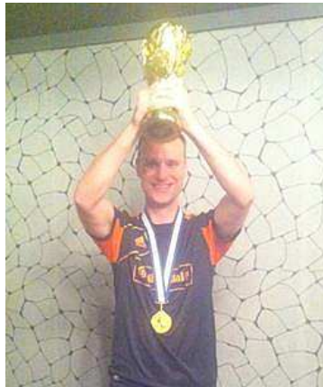
Hier der Pokal Football Worldcup Mongolia 2014