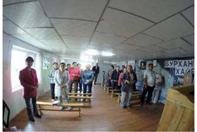
Hier Empfang und Gebet mit den Gemeinde Frauen. Hier der Anfang des Gottesdienstes. Erwartungsvolle Gesichter.