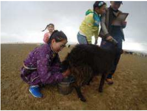
Verkündigung des Evangeliums in der Wüste