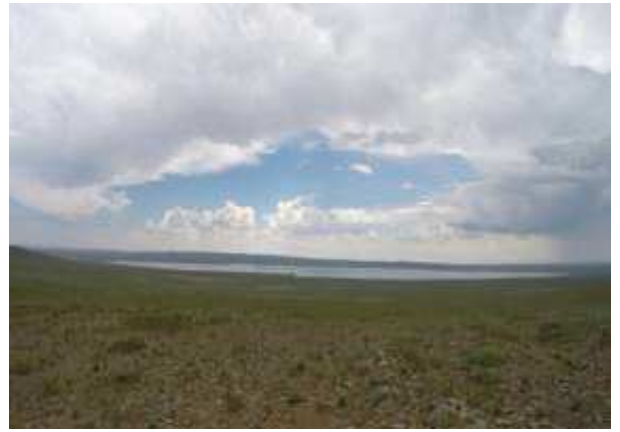
Rund um den Oogii See