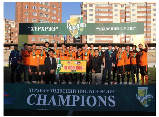
Randnotiz: Gewinn der Mongolischen Fußball Liga 2015