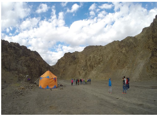
Verkündigung des Evangeliums Süd Gobi

Marc Kubin СРО. POST RESTANTE UB-211 213 MONGOLIA E-mail: mongolia.ministry@yahoo.com