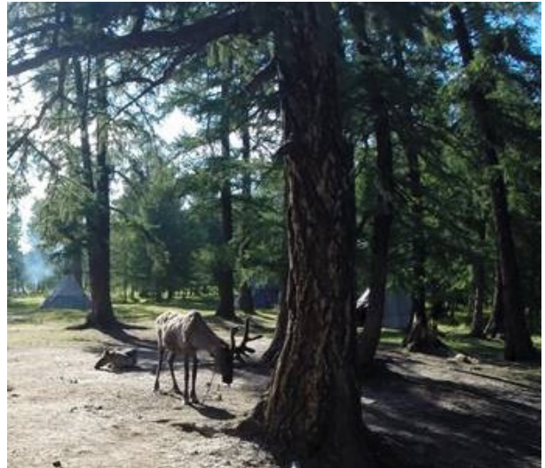
In der Khuskul Provinz leben die „Tsaatan“ Menschen in Indianer ähnlichen Zelten zusammen mit ihren Rentieren. Juli 2016.