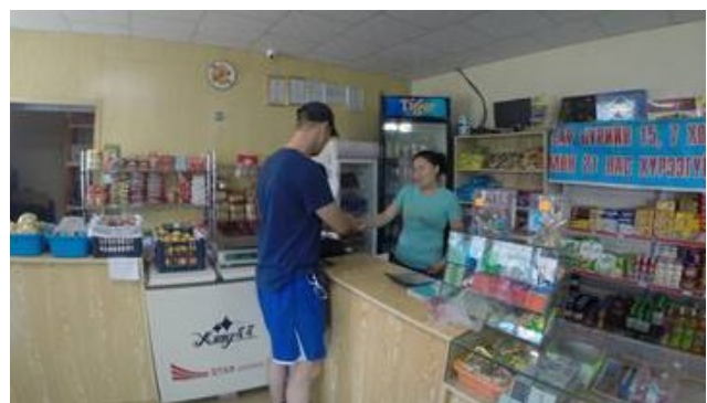
Das Wort Gottes verkündigen auf einem kleinen Dorfschulhof in dem Dorf Jargalant, 350 km Nordwestlich von Ul. Bator. Links, in einem Lebensmittel Laden.