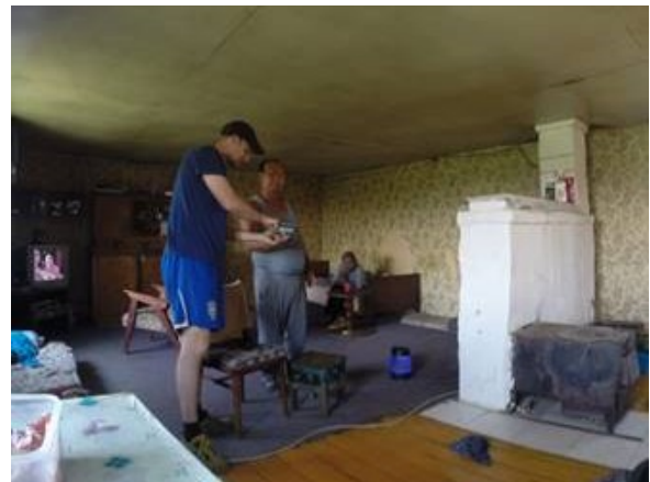
Evangelisieren auf dem Land. Vom Auto aus (Kinder verkaufen kleine Walderdneeren) und in den Häusern.