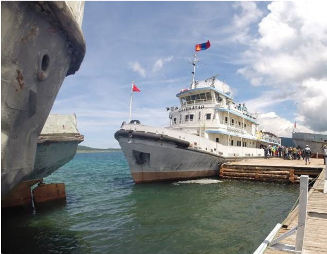
Das Schiff Sukhbataar am Khuskul See, fährt 2-mal am Tag für Touristen auf den See hinaus.