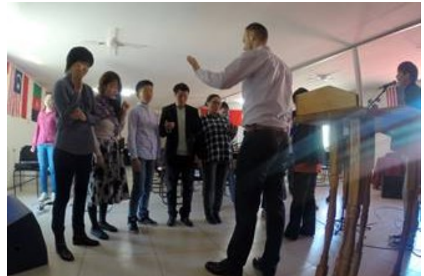
Ermutigende Predigt in der „Liebe des Vaters“ Gemeinde in Ulan Bator...