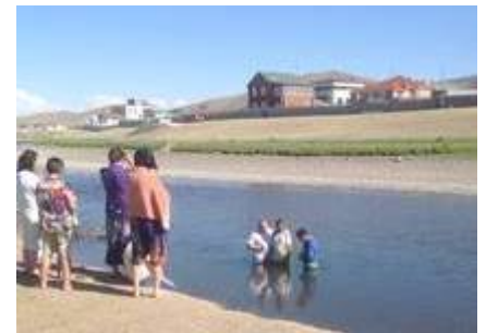
Taufe im Fluß. 9 Menschen kamen zum Glauben an Jesus. 7 neue und 2 waren Mitglieder bei Sekten wie z.B. „Mutter Gottes Kirche“. Sie kamen zum wahren Glauben an Jesus. Eine Frau war Mormonin und Buddhistin zugleich, sie nahm Jesus an und lies sich auch taufen.