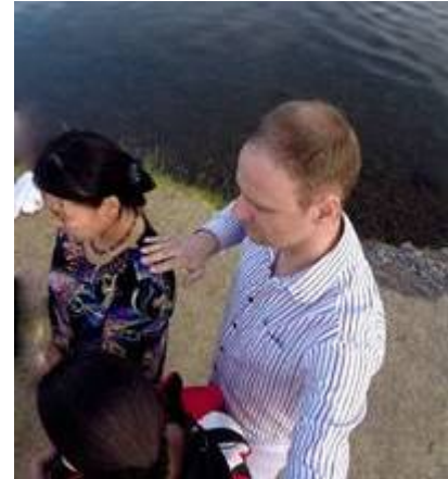
Segnungsgebet vor der Taufe im Fluss mit Freunden aus Kanada, 10 km ausserhalb von Ulan Bator Der Segen Gottes fließt.