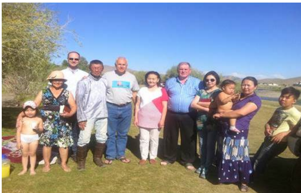
Das evangelistische Team aus Kanada und die Täuflinge