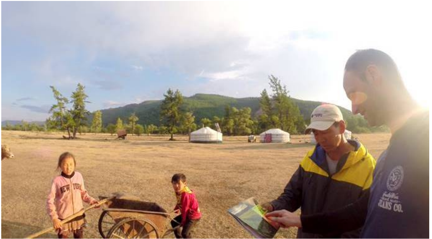
Von Ger zu Ger Evangelisation Sommer 2017

Vielen Dank mein lieber Freund und Partner. Danke das du diesen Brief gelesen hast, für deine Gebete deine finanzielle Unterstützung und deine Liebe zu diesem Dienst. Nur Gott weiss wie wichtig und kostbar du für diese Arbeit hier auch in Zukunft bist. Ich weiss es sehr zu schätzen. Bitte bete für meine Visa, es ist jetzt wieder fällig. Es kostet wieder einiges. Diese Woche muss ich es beantragen um weiter hier vor Ort Gottes Wort zu verkündigen. Es wäre wirklich klasse wenn du mir helfen könntest die anfallenden Kosten zu bewältigen.